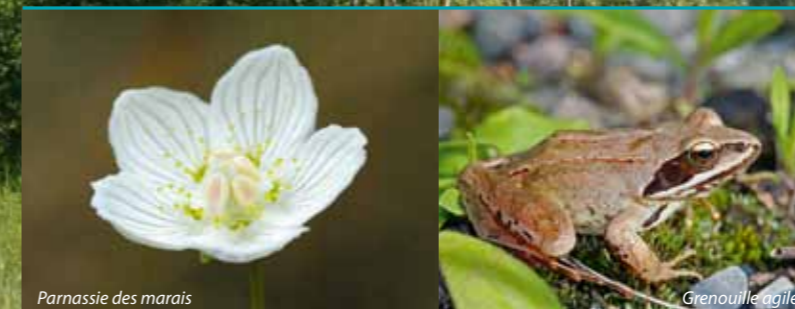
Parnassie des marais