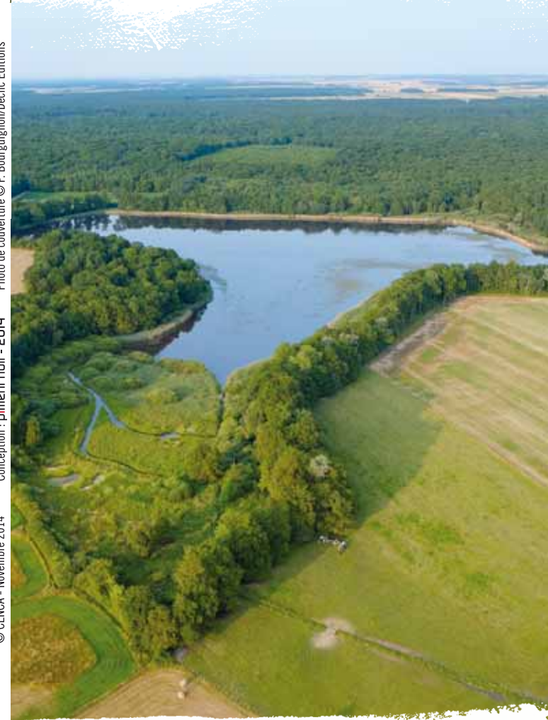
Conception : piment noir - 2014 © CENCA - Novembre 2014