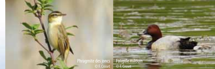
Phragmite des joncs