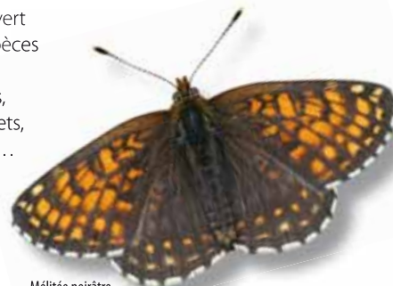
Mélitée noirâtre