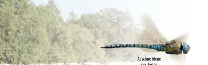
Aeschna bleue