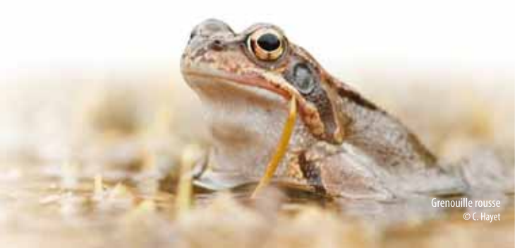
Grenouille rousse