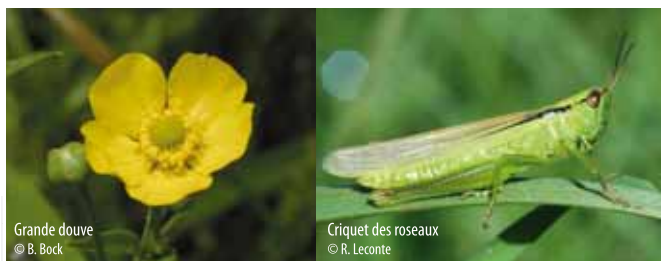
Grande douve

Une végétation riche et diversifiée s'organise sur et autour de l'étang. Que ce soit en période de pleine eau ou durant les mois d'assec, dans les roselières ou en forêt, des plantes rares trouvent refuge dans la réserve comme la Grande Douve, le Callitriche pédonculé ou encore la Léersie faux-riz.